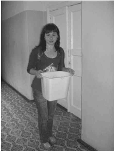
Ухаживали за цветами