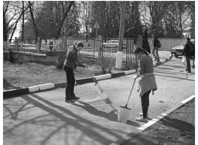
Подметали школьный двор