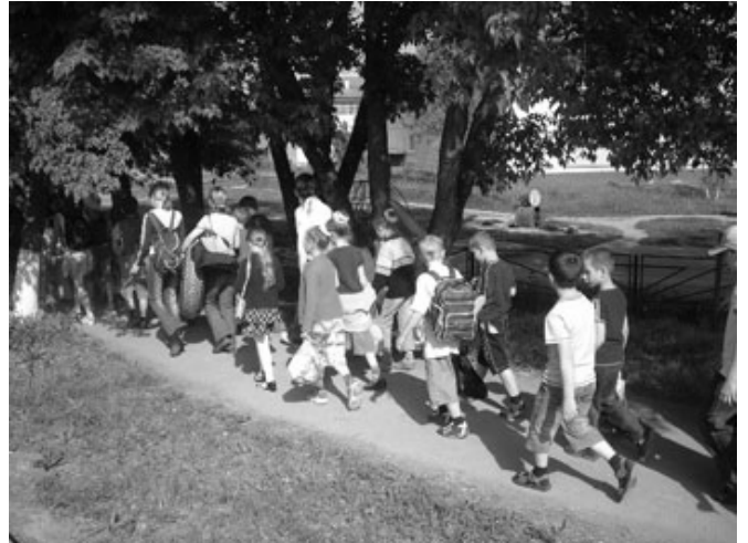
Идем в клуб

классов. Программа отдыха очень увлекательна. Ребятам здесь нравится и не зря.