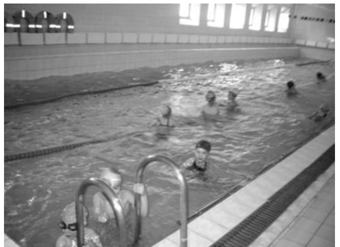
Мальчики – дельфины