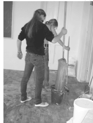
Вымыли до блеска классы