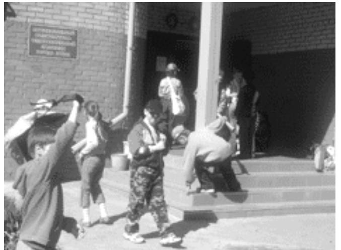
Идем в бассейн

Развлекательные игры на свежем воздухе, посещение клуба, в котором им показывают различные мультфильмы, устраивают дискотеки, викторины и игры.