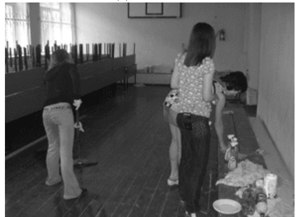
Работа в удовольствие